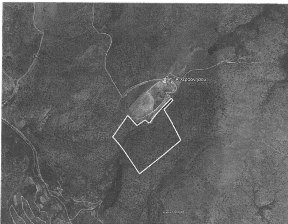
Εικ. 1. Έκταση προς Αποτύπωση

Η εν λόγω Υπηρεσία αφορά στην αποτύπωση έκτασης περίπου 320.000 τ.μ. (320 στρέμματα) νοτιοανατολικά των υφιστάμενων εγκαταστάσεων του ΧΥΤΑ Χερσονήσου, στη θέση «Πυργιά». Η λοφώδης αυτή έκταση διατάσσεται ανάντη του υποτυπώδους ρέματος που σχηματίζεται στο ανατολικό-νοτιοανατολικό όριο του ΧΥΤΑ Χ., σε υψόμετρα από +450 - +300 μ. και διακρίνεται από χαμηλή χορτολιβαδική βλάστηση και κατά τόπους έντονες κλίσεις, προοδευτικά μειούμενες κατά τη νοτιοανατολική διεύθυνση.