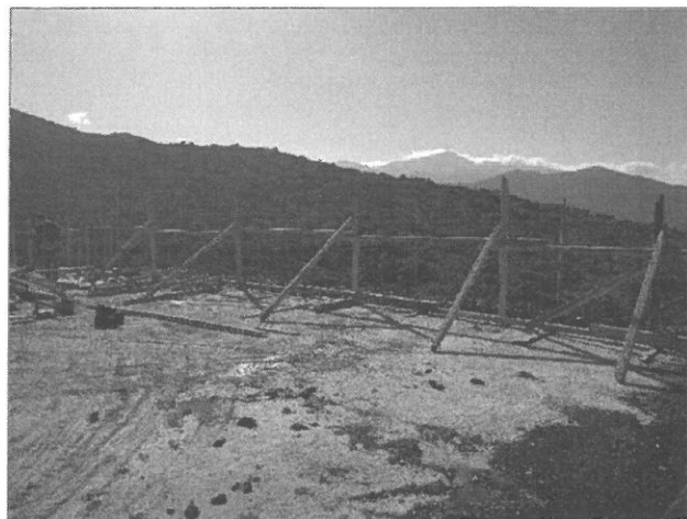
Εικ.2,3 Περιοχή προς αποτύπωση