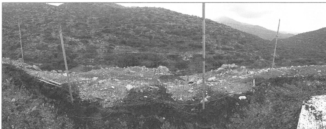
Εικ. 4 Πανοραμική άποψη έκτασης προς αποτύπωση